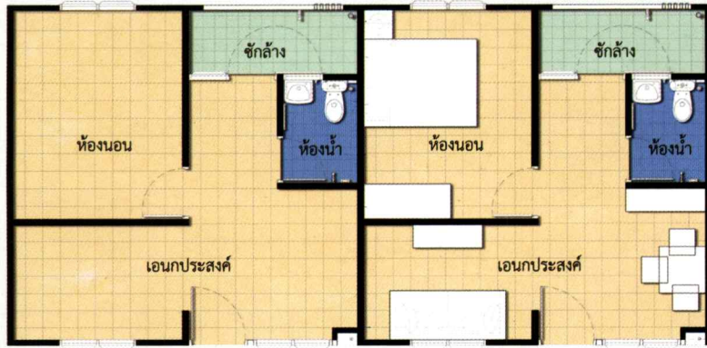
แปลนพื้นที่