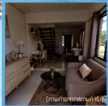
(ภาพถ่ายจากสถานที่จริง)