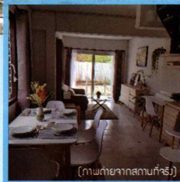
(ภาพถ่ายจากสถานที่จริง)