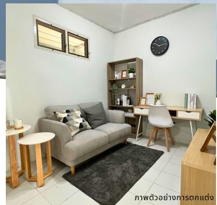
ภาพตัวอย่างการตกแต่ง