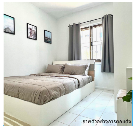
ภาพตัวอย่างการตกแต่ง