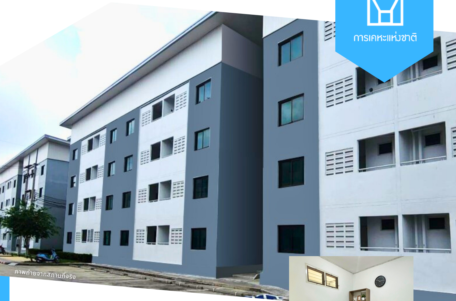
ภาพถ่ายจากสถานที่จริง