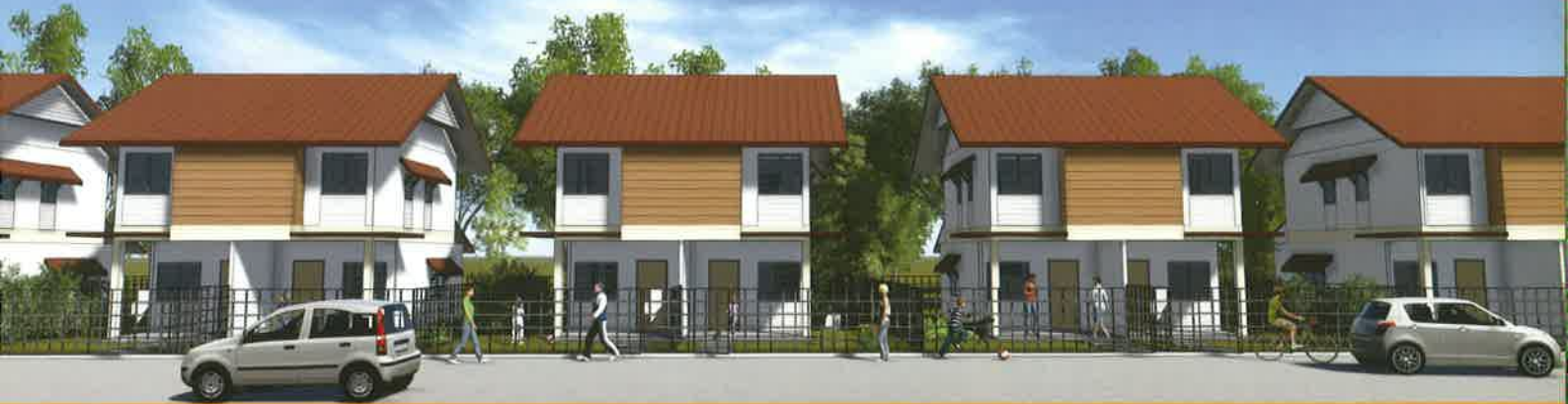
*ภาพจำลองรูปแบบอาคาร