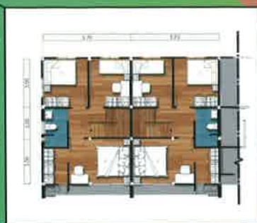
แปลนชั้นบน