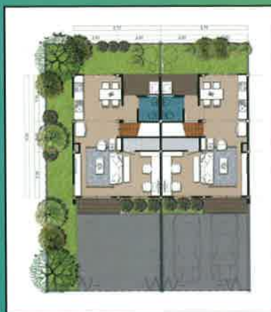
แปลนชั้นล่าง

เนื้อที่ประมาณ 23.5 ตร.วา 3 ห้องนอน 2 ห้องน้ำ