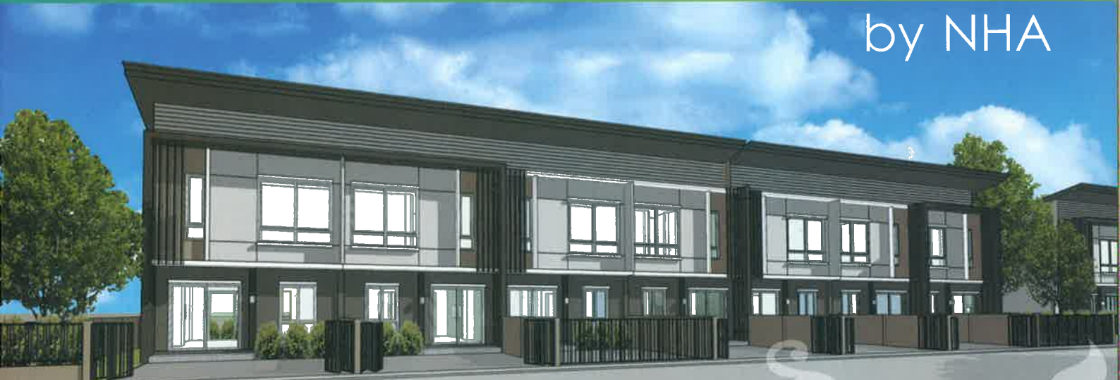
*ภาพจำลองรูปแบบอาคาร