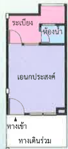
แปลนพื้นที่ 24 ตร.ม.