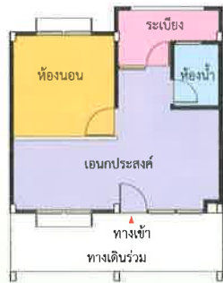
แปลนพื้นที่ 33 ตร.ม. (แบบ 2)