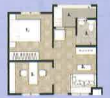
แปลนพื้นที่ 33 ตร.ม.