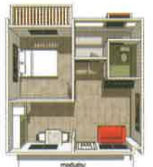
แปลนพื้นที่ 33 ตร.ม.