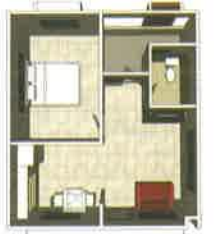
แปลนพื้นที่ 32 ตร.ม.