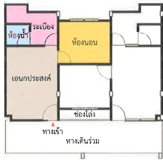
แปลนพื้นที่ 33 ตร.ม. (แบบ 1)