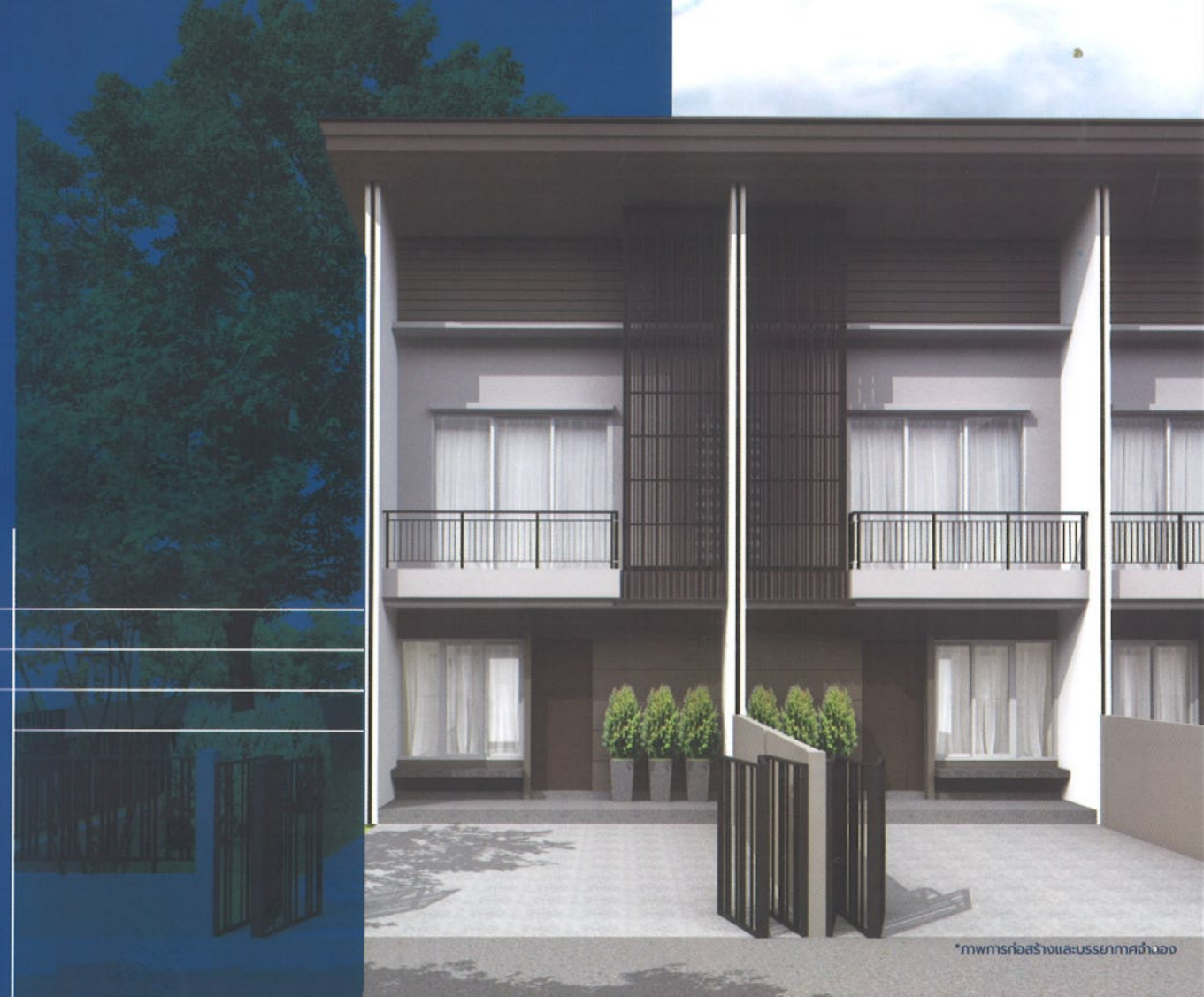
*ภาพก่อสร้างและบรรยากาศจำลอง