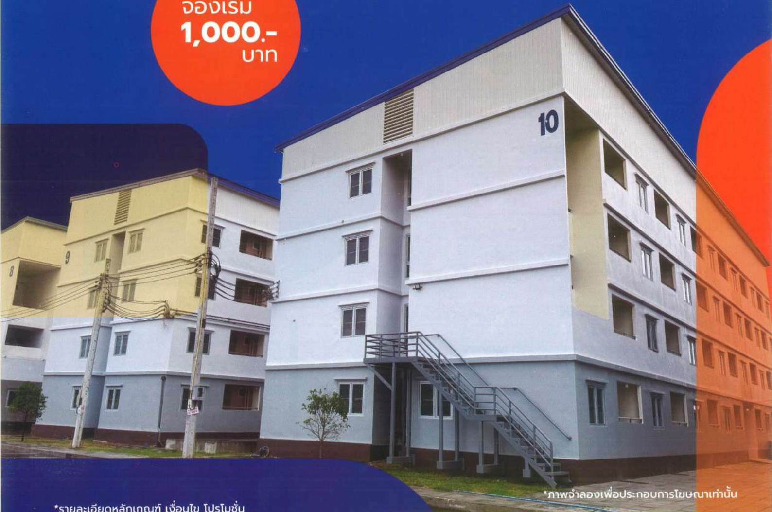
*ภาพจำลองเพื่อประกอบการโฆษณาเท่านั้น

*รายละเอียดหลักเกณฑ์ เชื้อนไข โปรโมชัน และโครงการที่เข้าร่วมเป็นไปตามที่การเคหะแห่งชาติกำหนด